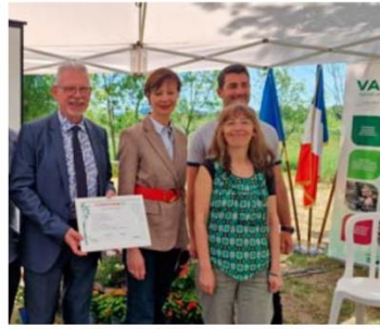
Le président du Département du Var, ravi de recevoir un prix pour cet espace naturel.

https://www.registre-dematerialise.fr/4615 pour y être tenue à la disposition du public pendant un an à compter de la date de clôture de l'enquête.